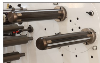
快速换卷 TURRET UNIT