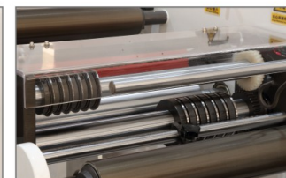
分切单元 SLITTING UNIT