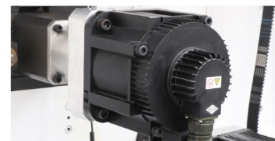
全伺服驱动 SERVO DRIVE