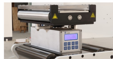
纠偏单元 WEB GUIDE