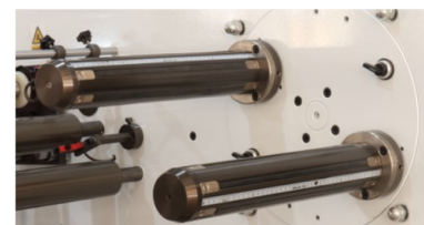
快速换卷 TURRET UNIT